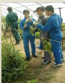
Ecologie et production végétale