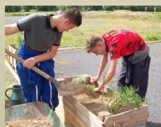
Aménagement de l'espace