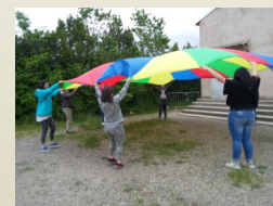
Animation des personnes