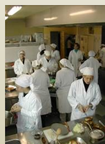
Alimentation et pâtisserie