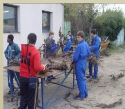
Bricolage, mécanique et matériaux